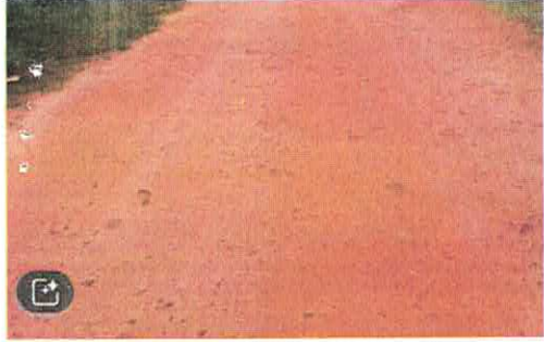
segunda-feira, 16 de março de 2026 · 10:30 Editar 20260316_103049.jpg /Armazenamento interno/DCIM/Camera